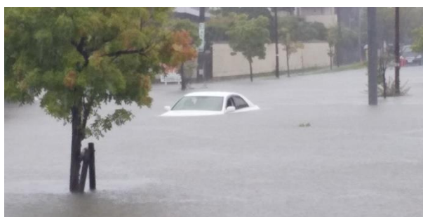
写真 内水氾濫による車への被害

一例として洪水を挙げましたが、本研究室では水災害の被害拡大に繋がる要因について、観測・解析の両面からの研究を行っています。