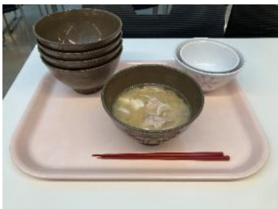
この日、私は学食で豚汁を5杯食べました。

以上のように、私は充実した大学を送ることができました。そのため、秋田大学で学ぶことができ、本当に良かったと、強く思っています。大学卒業後は大学での学びを活かしつつ、社会人として楽しく、充実した生活を送っていききたいと思っています。