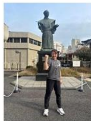
↑ 2026 鹿兒島マラソン