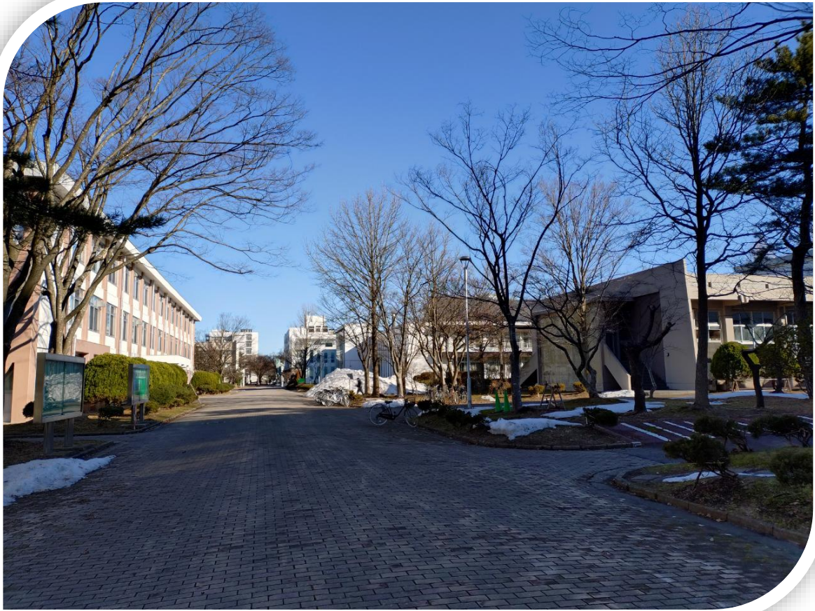
(キャンパスの風景 (2026.2.26) )