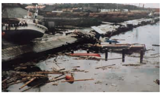
津波により打ち上げられた漁船（能代市川反町）

また、あわせて秋田大学地域防災減災総合研究センター構成員の研究についてもパネル展示を行い、来場者にセンターを知っていただく機会とします。