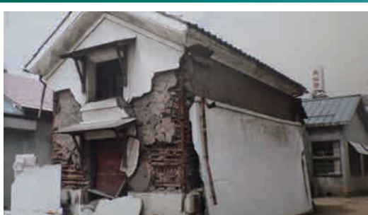
壁が落ちた土蔵（能代市役所）