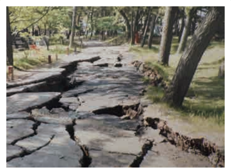
亀裂、陥没した道路（能代市萩の台墓地公園）

昭和58年（1983年）5月26日 日本海中部地震能代市の災害記録