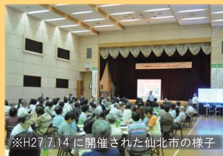
※H27.7.14 に開催された仙北市の様子

ご年配の方はもちろん、看護に興味がある方、ご両親やご祖父母に元気に過ごしてほしい方など、幅広い年代からのご参加をお待ちしております。