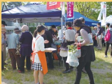
(開催場所：インフォメーションセンター前広場)