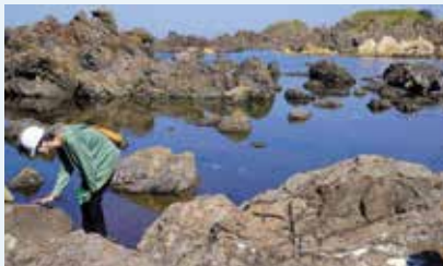
〈男鹿半島での地質調査〉

地球科学の知識をもとに資源の探査や評価、地質に関するコンサルティングを行うことのできる人材や研究者を養成します。