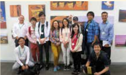
〈オーストラリアでの海外資源フィールドワーク〉

世界の資源情勢を正確に分析・考察する力や資源国との交渉力を身につけた資源戦略を担う人材を養成します。