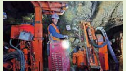
〈アメリカでの海外資源フィールドワーク〉

限りある地球資源を持続的かつ有効に活用するため、地球環境に配慮した資源開発と資源循環型社会の形成に寄与できる技術者・研究者を養成します。