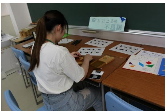
高校生や保護者の方々がパズルや心理実験に挑戦

② 展示企画：心理実践コースの卒業研究がポスターに展示され、学生の研究成果が分かります。“心理学トリビアカード”で豆知識を学べます。