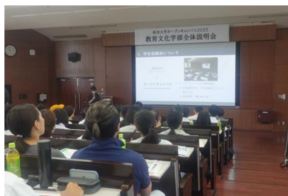
全体説明会での学部紹介