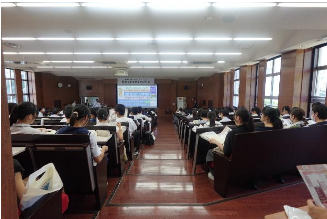
60周年記念ホールでの全体説明会の様子