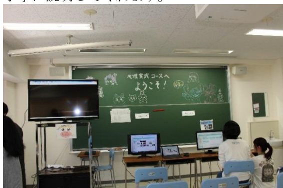
モニターに視線追跡画面を表示。右は錯視・錯聴体験

① 実験企画：視線追跡のデモンストレーション、錯視・錯聴体験、洞察パズル“タングラム”、鏡映描写実験など、様々な心理実験が体験できます。学生ボランティアが用具の使い方など丁寧に説明してくれます。