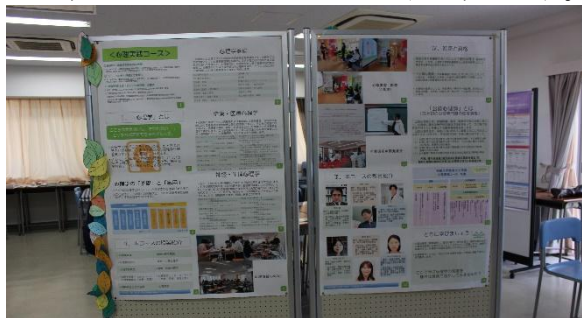
研究テーマは対人支援、SNS、化粧など多種多様

② 展示企画：心理実践コースの卒業研究がポスターに展示され、学生の研究成果が分かります。“心理学トリビアカード”で豆知識を学べます。