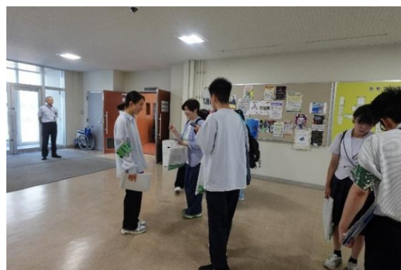
3号館ロビーでの案内