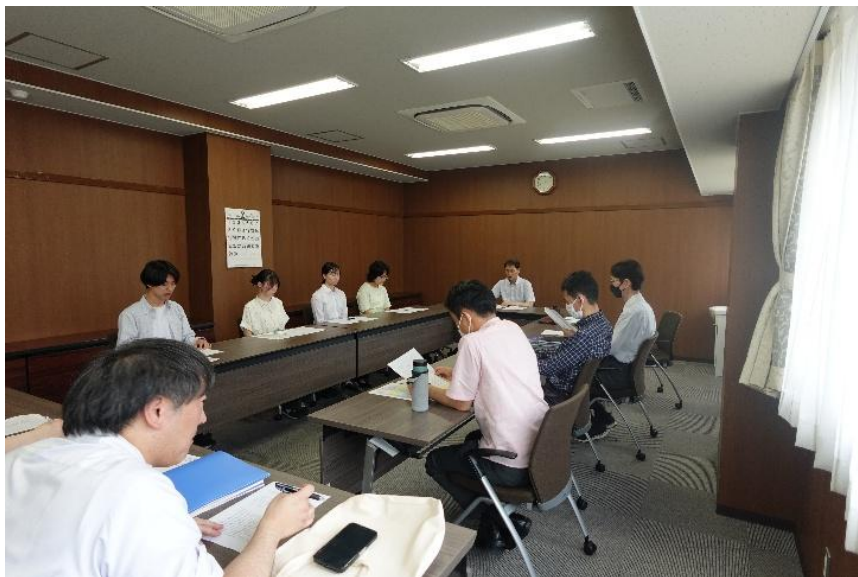
6月24日、学部長との懇談会

今後も、委員としての責任を果たしながら、学生の声に丁寧に向き合い、少しでも多くの想いを大学に届ける橋渡しの役割を果たしていきたいと考えております。そして、学生一人ひとりがより充実した大学生活を送ることができるよう、引き続き尽力してまいります。