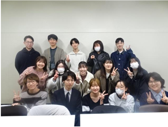
4月のミーティング（協議会室（右写真）にて）

学生協議会委員の活動に参加することで、自分たちの所属する組織について改めて考え、また改善していくための機会を得られます。 来年1月より、学生協議会委員のメンバーが入れ替わります。活動に参加したいという学生の皆さんは、ぜひWebClass「学生協議会」のメッセージ等でお知らせください！