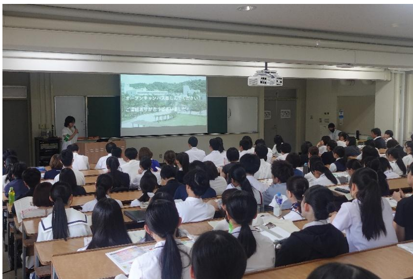
7月19日、オープンキャンパスの学部全体説明会での学部紹介

私たち学生協議会は学生の皆さんが充実したものになるよう日々努力しています。力が及ばないところは多々あるものの、できることを少しずつ着実にやっていこうと思います。より良い大学生生活のため、これからも活動をしていきますので今後ともよろしく願いいたします。