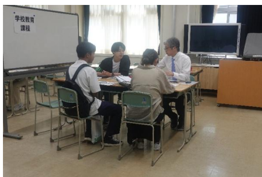
相談コーナーで広報委員の先生方と