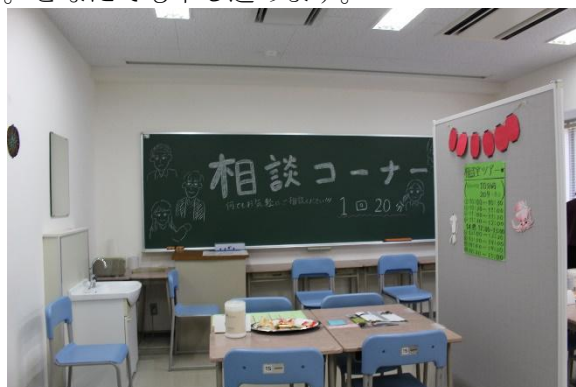
お茶を飲みながら気軽に相談できます

③ 相談企画：心理実践コースの学習、進路、資格のことなど、教員や学生が丁寧に説明します。どなたでも申し込みます。