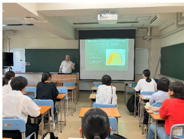
英語発音に関する教員のミニ講義

違いについて、口の中の舌の動きを確認したり、音を聞き分けるクイズをしながら学んでいました。