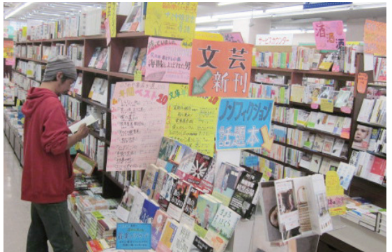
→学費日新で紹介した、さわや書店本店。色鮮やかなPOPであふれる（盛岡市）