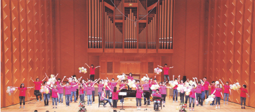
（写真） 昨年の定期演奏会の様子

秋田大学で最も活発に活動している文化系サークルといえる合唱団である。今年8月に行われた全日本合唱コンクール秋田県大会において金賞、大学一般部門最優秀賞、全日本理事長賞を受賞している。続く9月下旬に行われた東北大会では、全国大会出場を目指し、金賞を狙ったが、惜しくも銀賞を受賞する結果となった。活動はこれだけに留まらず、AChoirは地域との交流も行ってきている。昨年は明徳小学校合唱部とのコラボ演奏を行った。今年11月11日に行われる秋田市主催の「絆のコンサート2012」に「絆のコンサート2012」に参加する予定である。