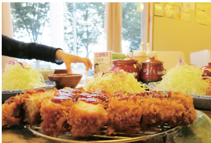
「Let's KATSU」 (嶋崎雄基)