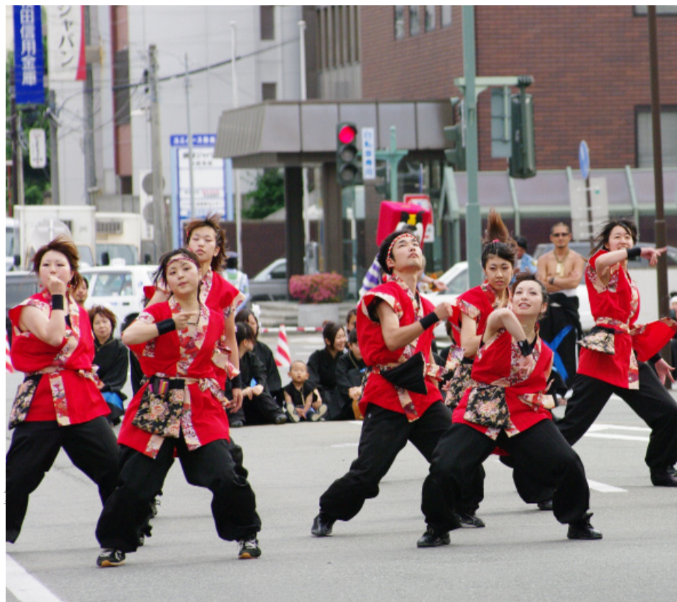
毎年、秋田市大町で行われるヤートセ秋田祭りの様子。（よさとせ歌舞輝＝秋大チーム）

引退の時、節目の時 一年間代表を務めた彼女も今月行われる秋大祭で引退の時を迎える。サークルの運営を三年次から二年次にバトンタッチする世代交代の時期だからだ。引退を間近にした彼女に後輩へ伝えたいことを聞いた。「いつまでも踊りを楽しんでほしいな」メンバーの仲の良さや自慢にする彼女はこれからも、踊りをチーム全員で楽しんでほしいと語る。そして彼女の