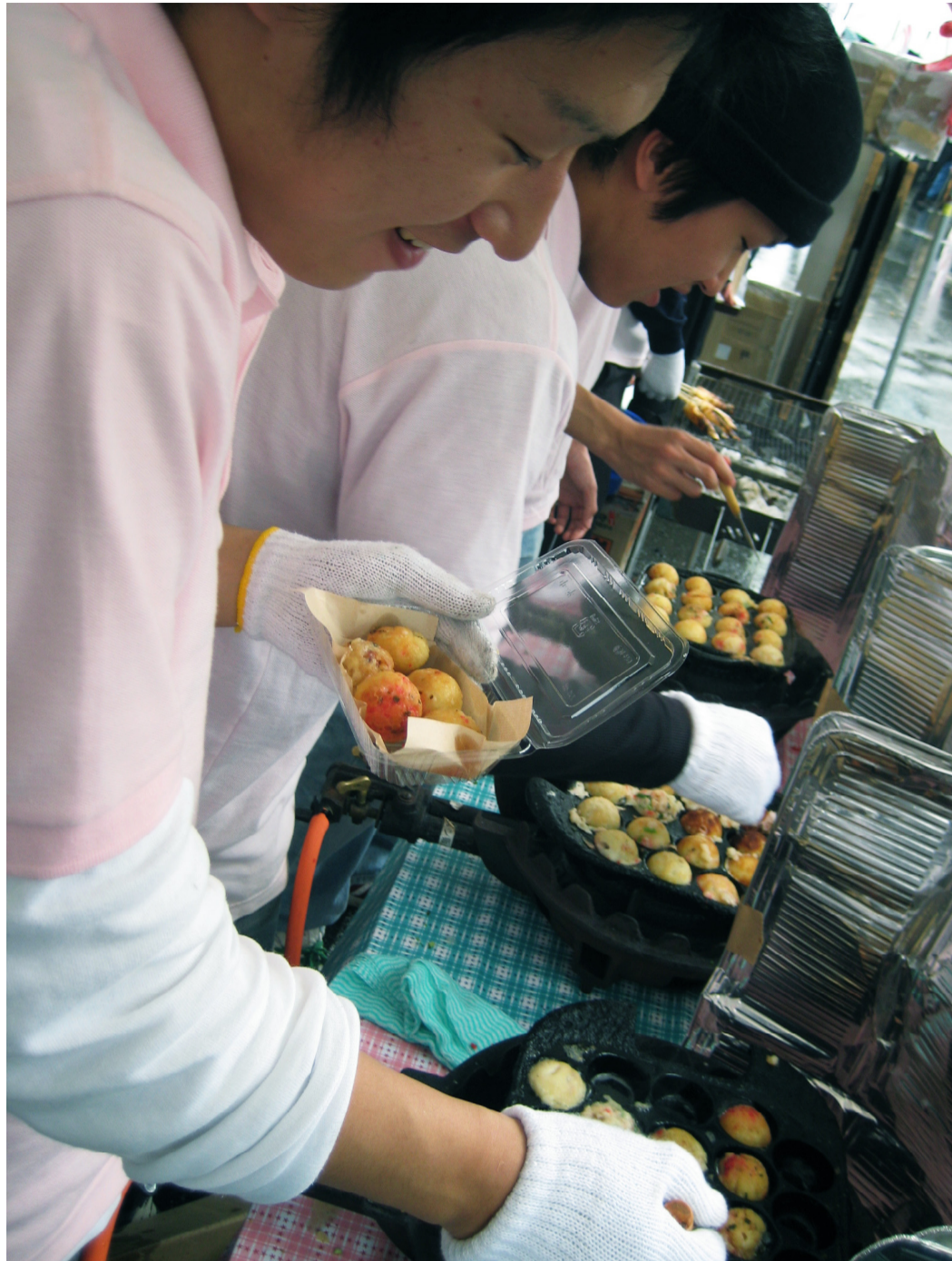
本昨年の秋大祭の一コマ。魅惑のたこ焼きは学生を虜にするだろう。(秋田大学生協学生委員会)

度も模擬店の出店者等の参加を募集している。しかし昨年に行うのではなく新たな試みを行うことはもちろんだ。その一つは期間中のみ使用できる独自通貨「ジェニコ(仮)」を発行することだ。これを用いたイベントを多数実施することで、イベント集客力と模擬店出展者の意欲の強化、イベントのオリジナリティ向上を目指している。また模擬店の売り上げランキングの順位付けを実施し上位団体には独自賞の副賞を授与することも考えているそうだ。