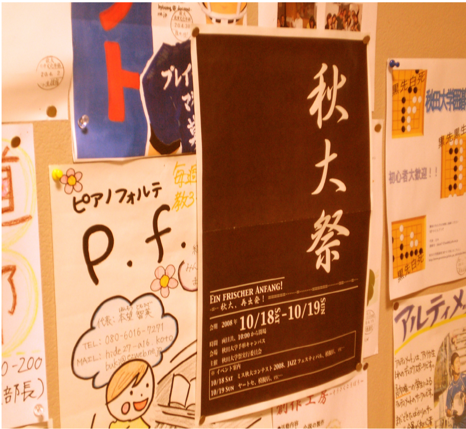
今年度の秋大祭ポスター。秋大の深みを表す葡萄茶色の図案は、学生に主体性を静かに訴えかけている。(=教育文化学部2号館1Fにて)