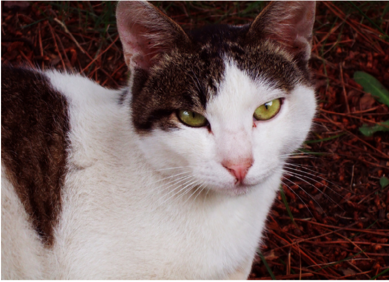
秋大に住んでますけど何か？ 工学部1号館