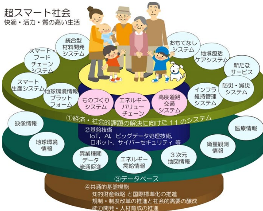
「Society 5.0の実現」に向けた各講座の位置づけ 参考：内閣府Society 5.0の実現を支えるプラットフォーム

“超スマート社会”の実現には、様々な「もの」がネットワークを介してつながり、それらが高度にシステム化されるとともに、複数の異なるシステムを連携強調させることが必要です。しかし、これを一気に構築することは難しく、政府は「Society 5.0の実現」に向けたプラットフォームとして、「①経済・社会的課題の解決に向けた11のシステム」を設定し、IoTやAI（Artificial Intelligence）、ビッグデータ処理技術などの「②基盤技術」、各システムの高度化やデータの利活用を促進するための「③データベース」、「④知的財産戦略、人材育成の推進など」の体制を構築しようとしています。