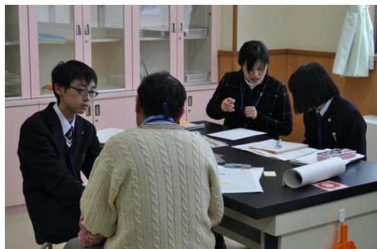
中学校教員と実習授業の打合せ