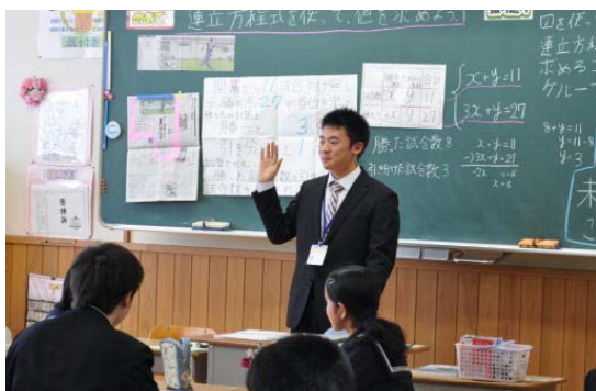
最終日の実習授業(大学生)