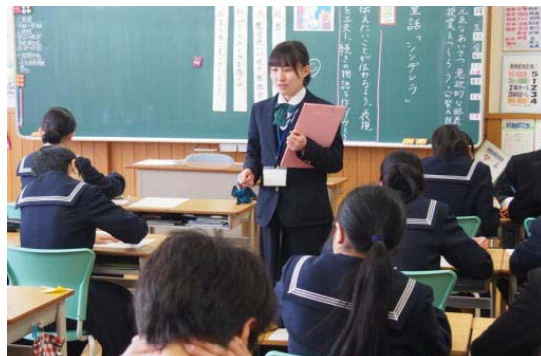
最終日の実習授業(高校生)