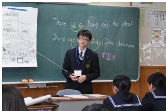
実習模擬授業(高校生)