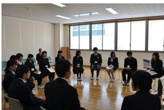
懇談会(H29は不登校経験者との懇談)