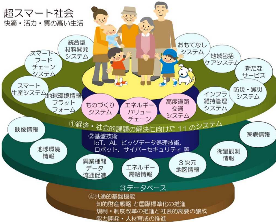
「Society5.0の実現」に向けた各講座の位置づけ 参考：内閣府 Society5.0の実現を支えるプラットフォーム

“超スマート社会”の実現には、様々な「もの」がネットワークを介してつながり、それらが高度にシステム化されるとともに、複数の異なるシステムを連携強調させることが必要です。しかし、これを一気に構築することは難しく、政府は「Society5.0の実現」に向けたプラットフォームとして、「①経済・社会的課題の解決に向けた11のシステム」を設定し、IoTやAI(Artificial Intelligence)、ビッグデータ処理技術などの「②基盤技術」、各システムの高度化やデータの利活用を促進するための「③データベース」、④「知的財産戦略、人材育成の推進など」の体制を構築しようとしています。