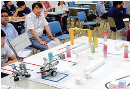
【創造工房実習（2年次）での競技会の様子】

電気電子工学コースでは、発電や蓄電技術、電子デバイス技術、情報通信技術、制御技術を通じて、社会に役立つ技術開発能力を身につける教育研究を行います。