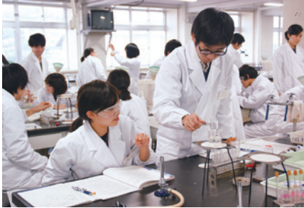
【基礎化学実験（1年次）の様子】

生命科学コースの教育プログラムでは、化学と生物学を中心とした広範かつ先端の知識と研究技術が習得可能です。