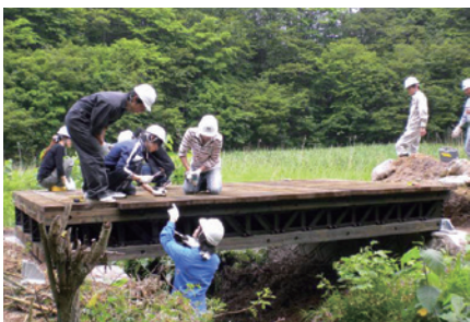
【オンサイト木橋の施工を手伝う学生たち】

土木環境工学コースでは、自然環境・社会環境に配慮した社会基盤の整備・維持・管理や安全・安心・快適な地域環境の創造・保全についての教育研究を行います。