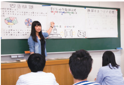
【勉強成果を発表するセミナーの様子】

数理科学コースでは、数理科学の理論と応用を学び、社会の諸問題の解明に活用したり、高等学校教員（数学）・中学校教員（数学）となり地域の理数系教育の向上に貢献するための教育研究を行います。