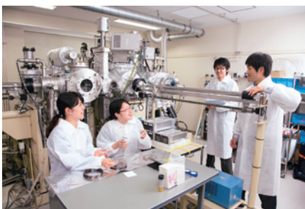
【磁性薄膜を作製するための準備の様子】

材料工学コースでは、金属、セラミックス、半導体をベースに材料物性の微視的発現機構を探索しながら、生産プロセスの技術開発を実現するための教育研究を行います。