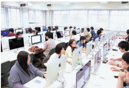
【プログラミング実習の様子】

人間情報工学コースでは、ヒトを中心とした情報処理システムの開発を通して、地域社会の課題を解決し新たな価値を創造するための教育研究を行います。