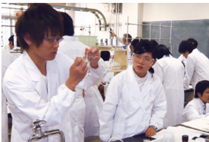
【ホールピペット、ビュレットを用いた分析化学実験（2年次）の様子】

応用化学コースでは原子・分子レベルの化学から、化学を活かしたもののづくりまでをカバーした教育研究を行います。