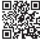
秋田大学受験生ポータルサイト QRコード

秋田大学ホームページ https://www.akita-u.ac.jp/ 秋田大学受験生ポータルサイト https://www.akita-u.ac.jp/admission/