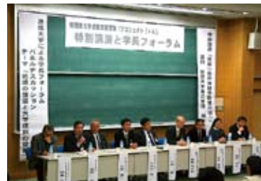
特別講演と学長フォーラムの様子 (平成20年12月6日)