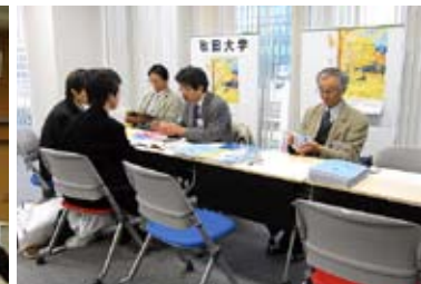
「秋田の大学入試説明会 in 東京」で 秋田大学の説明を受ける高校生 (平成20年12月14日)