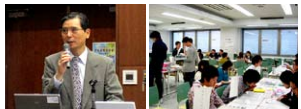
学長連続講演会の一コマ (平成21年6月)