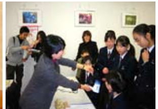
「あなたも、もしかしたら工学女子？」開催(平成21年12月)