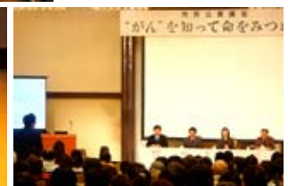
第5回北東北がんプロフェSSIONAL養成プランFDワークショップ(平成23年2月5日)