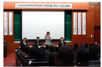
文部科学省科学研究費補助金新学術領域研究「がん研究分野の特性を踏まえた支援活動」青少年・市民公開講座(平成22年10月9日)

本プロジェクト活動の一環として毎年行っています「北東北がんプロフェSSIONAL養成プランFDワークショップ」を2月に開催しました。5回目を迎えた今回もがん診療に携わっています医療関係者、今後がん診療に従事したいと考えている学生、一般の方々など、500名を超える参加がありました。