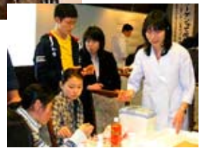
「親子でサイエンス～ようこそ! コラーゲンの世界へ～」開催 (平成22年12月)

〈秋田大学 男女共同参画推進室 coloconi(コロコニ)コンシェルジュ・デスク〉