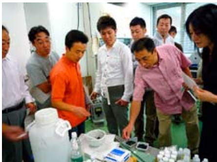
リサイクル技術に関する実習

このような背景から、秋田大学と秋田県は密接に連携し、さらには県内外の有識者や企業・自治体の協力を受けながら、本プログラムの主要事業として、「あきたアーバンマイン開発アカデミー」を創設し、エネルギー工学を含む資源学を始点に、有用金属の選別・生産技術やリサイクリング技術、バイオマスエネルギーの利用等の化学関連技術、そして県内の情勢を含めた環境学や社会学、経済学などについて講義を行い、環境・リサイクル産業を理解し利用技術に展開することを目的とした、人材養成を行っています。