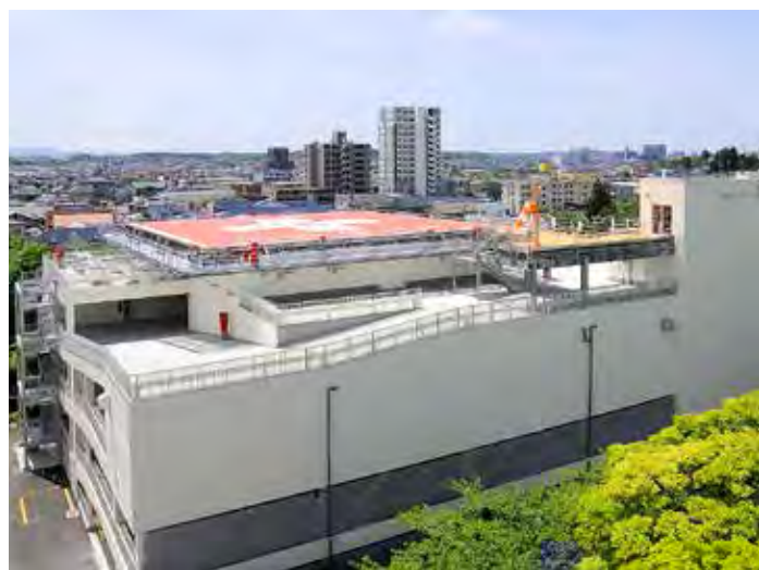
ヘリポート及び立体駐車場