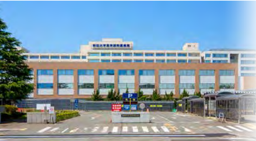
医学部附属病院(正面)

医学部附属病院は、教育研究施設であるとともに、地域における医療機関の中核として各専門分野にわたる豊富な知識と最新の医療機器等による診療機能を駆使する医療機関であり、平成6年には特定機能病院として承認を受け、地域に対する指導的役割を担う病院として、今後なお一層地域社会への貢献を行います。