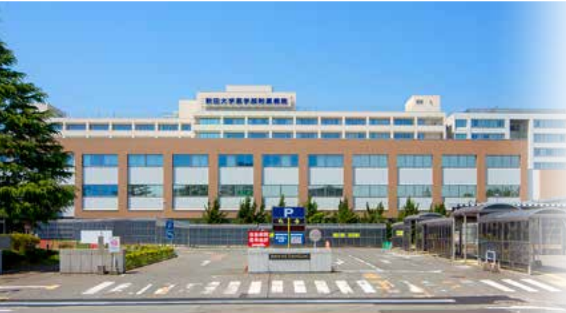
医学部附属病院(正面)

医学部附属病院は、教育研究施設であるとともに、地域における医療機関の中核として各専門分野にわたる豊富な知識と最新の医療機器等による診療機能を駆使する医療機関であり、平成6年には特定機能病院として承認を受け、地域に対する指導的役割を担う病院として、今後なお一層地域社会への貢献を行います。