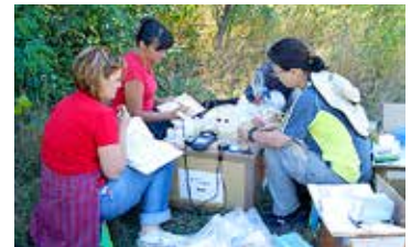
セルビア共和国での調査の様子

環境汚染に悩まされるセルビア共和国の銅資源開発地域において先進リモートセンシングデータと地表データを組み合わせた3次元的な環境評価・解析と高度な金属回収技術を融合し、持続可能な資源開発に不可欠な開発と環境との両立を目指した広域環境評価修復システムの研究開発を進めています。