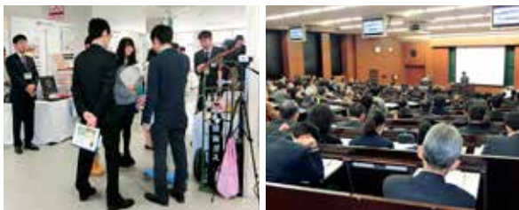
秋田ものづくりオープンカレッジ 平成29年度COC+フォーラム

平成27年度の文部科学省の新規重点補助事業で、地域活性化の拠点となる大学の形成に取り組んできた「地(知)の拠点整備事業(COC事業)」を発展させ、地方公共団体や企業等と協働して、学生にとって魅力ある就職先を創出・開拓するなど、地方創生の中心となる「ひと」の地方への集積を図ろうとするものです。県や商工団体など事業協働機関とともに、5年間で「学生の地元就職率10%アップ」を目指します。