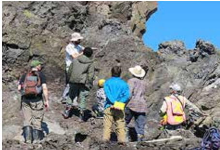
男鹿半島での地質調査の様子

大学院国際資源学研究科に「資源ニューフロンティア特別教育コース」を開設し、従来の資源学に留まらずリサイクルや資源経済、さらに環境保全や資源リテラシー、異文化理解、国際関係などを含めた知識、能力を養成し、21世紀の国際資源開発に関わる諸問題に俯瞰力をもって挑める人材「資源ニューフロンティアリーダー」の育成を目指します。