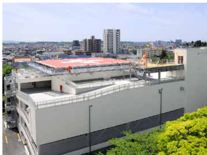
ヘリポート及び立体駐車場