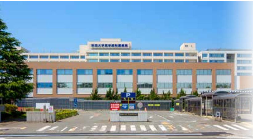
医学部附属病院(正面)

医学部附属病院は、教育研究施設であるとともに、地域における医療機関の中核として各専門分野にわたる豊富な知識と最新の医療機器等による診療機能を駆使する医療機関であり、平成6年には特定機能病院として承認を受け、地域に対する指導的役割を担う病院として、今後なお一層地域社会への貢献を行います。