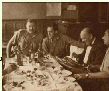
食卓につくヘミングウェイ（左端）（クレイグ・ボレス『ヘミングウェイ 美食の冒険』（アスキー、1999年）から）