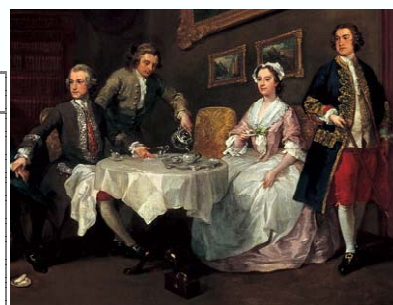
朝の紅茶（ウィリアム・ホガース「ストロード家の人々」（部分）、『テイトギャラリー』（ミュージアム図書、1996年）所収）