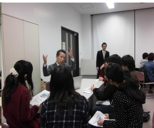
※フリートーク時の様子