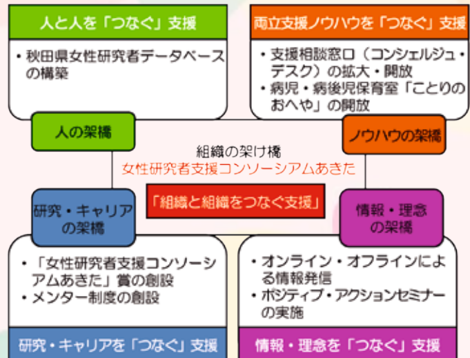
「架橋型ソーシャルキャピタル」の形成による 女性研究者支援

今後も秋田大学を拠点に女性研究者支援を進め、より働きやすい環境を作り、女性研究者比率アップを目標に取組を進めて行きたいと思えます。