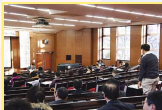
たくさんの声が上がった質疑応答

講演後の質疑応答では学内外問わず質問や意見などたくさんの声が上がりました。また、講演後のアンケートでは「国の政策、方針説明が直接聞けて良かった」、「資料が詳細で分かりやすかった」等満足頂けたというお声もたくさんありました。国の男女共同参画の考え方やそれを取り巻く社会の現状に理解を深められた大変有意義なフォーラムとなりました。