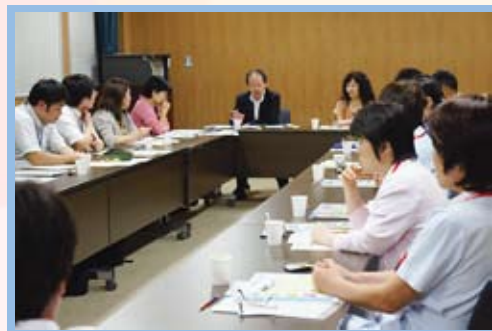
コロコニトーキングの様子

トーキングとなりました。参加者からは、「育児休業中は、給付金の支給と社会保険料の免除はあるが無給になるので、どのくらい収入減になるのか提示してもらえるとよい」や「育児休業を取得したくても、同僚に迷惑がかかるからと取得できずにいる人もまだいるため、職場の理解や休業を取得しやすい雰囲気づくりが、さらに必要ではないか」等の意見・要望が出されました。