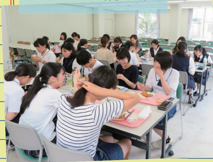
懇談しながら昼食をとる様子