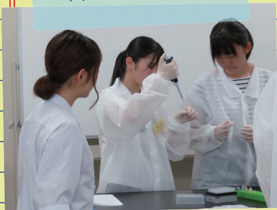
マイクロピペッターを操作