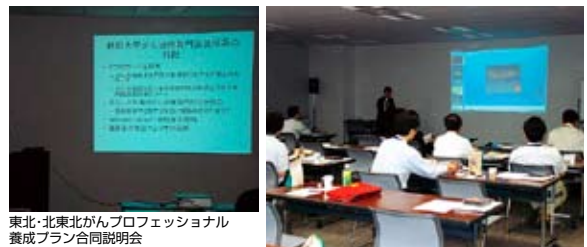
東北・北東北がんプロフェッショナル養成プラン合同説明会(平成20年7月4日)