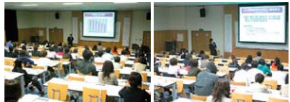
秋田大学緩和ケア研修会(平成20年5月31日)