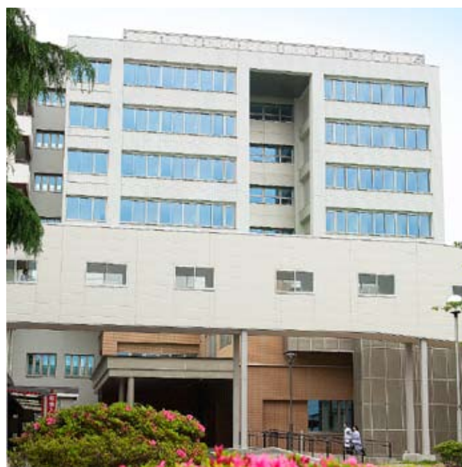
第2病棟(平成21年10月開院予定)