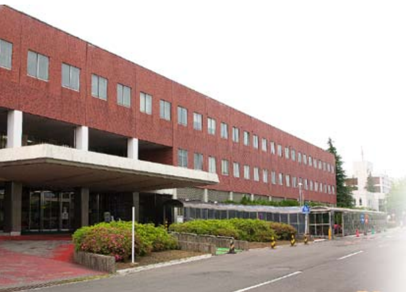
外来・中央診療棟(正面玄関)

医学部附属病院は、教育研究施設であるとともに、地域における医療機関の中核として各専門分野にわたる豊富な知識と最新の医療機器等による診療機能を駆使する医療機関であり、平成6年には特定機能病院として承認を受け、地域に対する指導的役割を担う病院として、今後なお一層地域社会への貢献を行います。