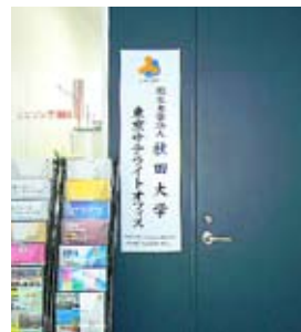
東京サテライトオフィス