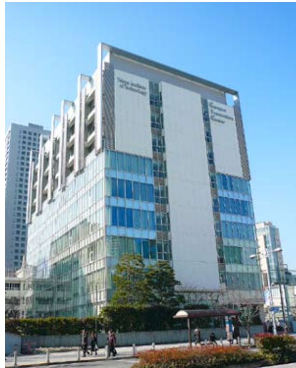
キャンパス・イノベーションセンター東京