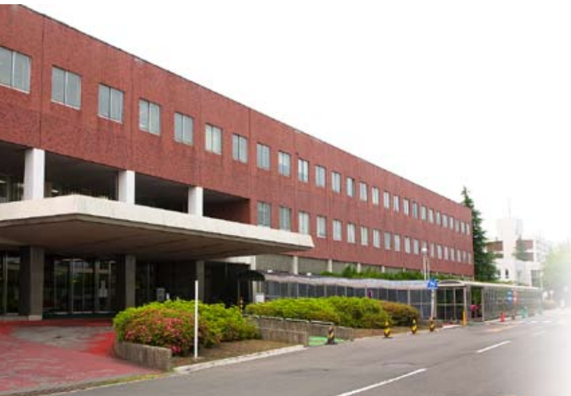
外来・中央診療棟(正面玄関)

医学部附属病院は、教育研究施設であるとともに、地域における医療機関の中核として各専門分野にわたる豊富な知識と最新の医療機器等による診療機能を駆使する医療機関であり、平成6年には特定機能病院として承認を受け、地域に対する指導的役割を担う病院として、今後なお一層地域社会への貢献を行います。