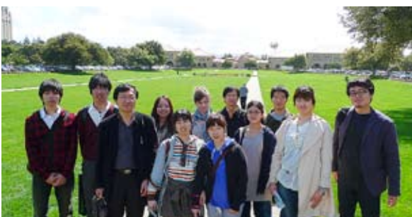
カリフォルニア大学アーバイン校、スタンフォード大学を訪問 (平成24年3月)