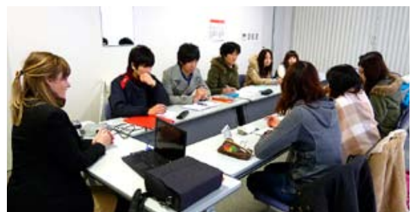
科学英語の講義の模様